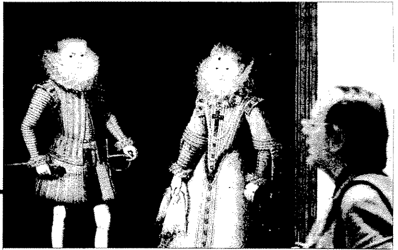
Un visitante observa la obra «El infante don Carlos y la infanta María Ana».