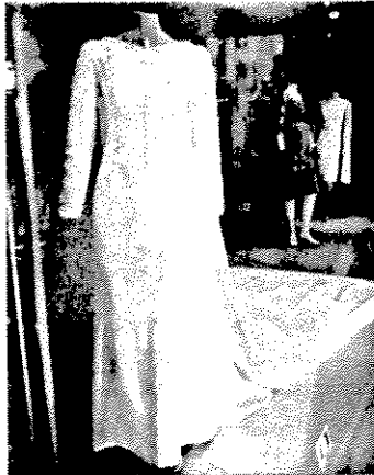
Trajes de la colección Balenciaga.

mundo se equivoca», permitía variar que tampoco en el futuro entonaría el meu culpa y obraría en consecuencia. Los socialistas fueron entonces implacables. «La consejera se ha conducido de manera irresponsable; su actuación revela su incapacidad manifiesta y su incompetencia», afirmaron.