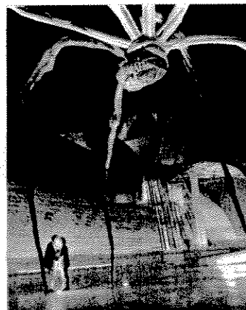
Exterior del museo Guggenheim de Bilbao.