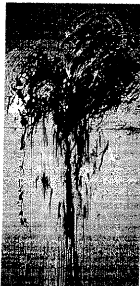
Una de las obras de Twombly.

La superficie de sus lienzos aparece muchas veces cubierta de garabatos, inscripciones, nombres de personajes mitológicos, citas fragmentarias de poemas clásicos, pero también símbolos priápicos, vulvas y otros elementos de fuertes connotaciones sexuales. Su arte es enigmático y abierto a toda suerte de interpretaciones. Comisariada por Carmen Giménez, la exposición se podrá ver hasta el 15 de febrero. >M.R.